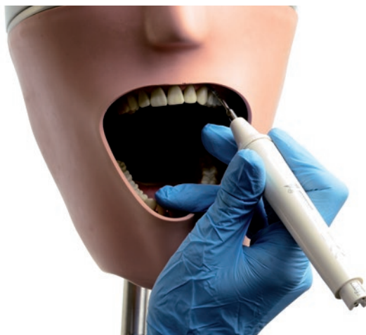
Rys. 26. Podparcie wewnętrzne