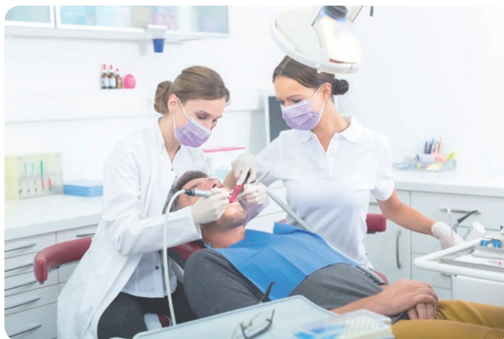
Rys. 27. Praca metodą Beacha