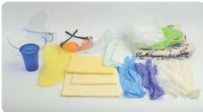
Rys. 2. Zestaw środków ochrony osobistej dla pacjenta i personelu