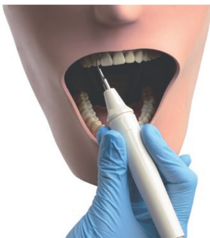
Rys. 25. Podparcie zewnątrzustne

Podparcie wewnątrzustne to podparcie np. na zębach sąsiednich, przeciwstawnych, o przedsiónek lub wyrostek kostny.