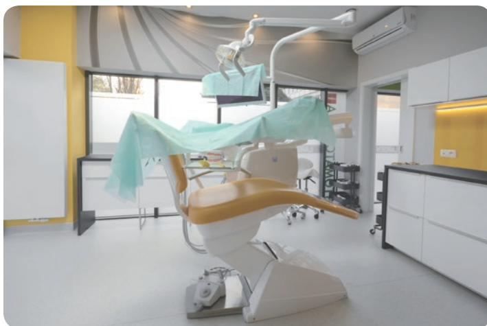
Rys. 1. Unit stomatologiczny zabezpieczony chustami na koniec dnia pracy